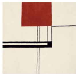
WENDINGEN 1925 - 1935