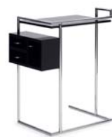
PETITE COIFFEUSE 1929