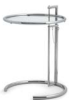
ADJUSTABLE TABLE E 1027 1927

Authorised by The World Licence Holder Aram Designs Ltd, London