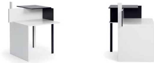
Schwarz und weiß black and white

Mesa de multiplex, haya maciza y MDF. Laca mate en blanco y negro. Detalles y colores ver lista de precios.