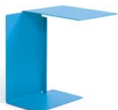
DIANA B 2002