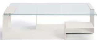
DIANA D 2002