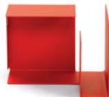
Feuerrot flame red