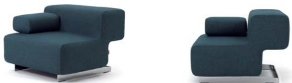
Mimikri blau blue

Estructura de acero cromado. Marco de madera dura acolchado. Acolchado: poliuretano con espuma. Tapicería de tela o cuero. Detalles y colores ver lista de precios.