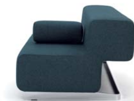
Mimikri blau blue