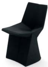
Sayonara schwarz black

Silla con asiento y respaldo acolchado. Pié de poliuretano rígido. Asiento de tubos de acero con poliuretano en diferentes densidades. Tapicería de tela o de cuero. Detalles y colores ver lista de precios.