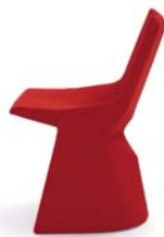
Divina rot red