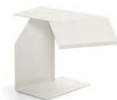
DIANA F 2002