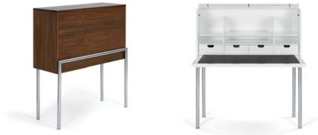
Amerikanisch Nussbaum walnut

Secretar en multiestrato y MDF. Chapa de madera auténtica o laca de brillo intenso. Superficie de trabajo plegable, cuatro cajones, seis compartimentos y un estante secreto. Cerrable. Estructura de tubos de acero cromado. Detalles y colores ver lista de precios.