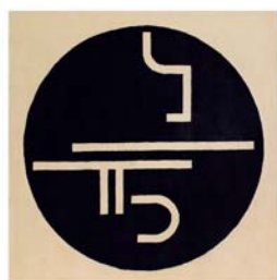
ST. TROPEZ 1925 - 1935

Authorised by The World Licence Holder Aram Designs Ltd, London