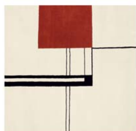
WENDINGEN 1925 - 1935