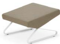
Mimikri beige beige