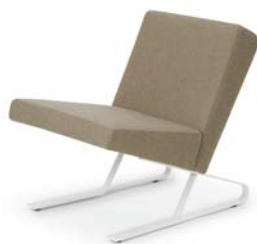
SATYR ARMCHAIR 2008