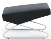
Leder schwarz leather black

Estructura de acero cromado o microestructura de laca pulverizada. Acolchado: madera, poliuretano en diferentes densidades y espuma. Patillas intercambiables de fieltro o plástico. Tapicería de tela o cuero. Detalles y colores ver lista de precios.