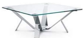
Chrom klar chrome clear

Estructura de acero cromado o laca pulverizada. Tablero de vidrio inastillable claro o ahumado. Detalles y colores ver lista de precios.