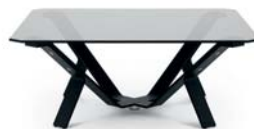
Schwarz rauch black smoked