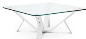
Weiß klar white clear