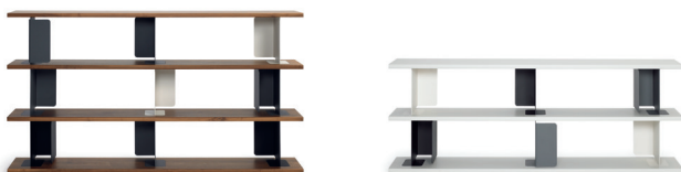
PARIS SHELF 2004

Barber Osgerby has been developing collections of distinctive designs for leading manufacturers such as Magis, Authentics, ClassiCon, Isokon Plus, Stella McCartney, Established & Sons and Flos. Among the many prestigious accolades won by Barber Osgerby there is to named especially the nomination for the Compasso d’Oro in 2004 or the award as best Furniture Designers of the year in 2005 by the Blueprint magazine.