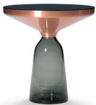
Kupfer copper | Quarz-grau quartz grey

Miniatura. En relación 1:5 al original. Pie de vidrio soplado disponible en diferentes colores con cuerpo de metal sobrepuesto de latón macizo, con lacado transparente, o con pie de vidrio de color cuarzo gris con cuerpo metálico sobrepuesto de cobre macizo, con lacado transparente. Tablero de mesa redondo de cristal, con lacado negro. Para más detalles y colores, ver lista de precios.