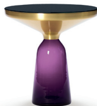
Amethyst-violett amethyst violet