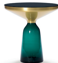
Smaragd-grün emerald green