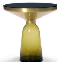
Citrin-gelb topaz yellow