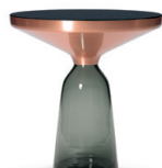
BELL SIDE TABLE COPPER Special Edition 2013