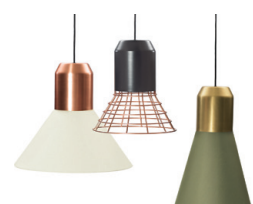
BELL LIGHT 2013