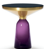
BELL SIDE TABLE 2012