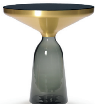
Messing brass | Quarz-grau quartz grey