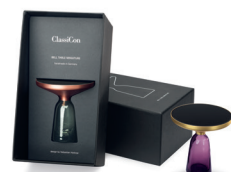
BELL TABLE MINIATURE 2014