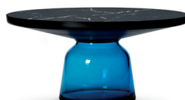
Saphir-blau sapphire blue Marmor marble Nero Marquina