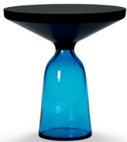
Saphir-blau sapphire blue

Mesa auxiliar y mesa de centro hechas a mano. Pie de cristal soplado en distintos colores. Estructura de acero macizo con pavonado negro, laqueado claro. Tablero de cristal laqueado en negro o tablero de mármol en distintas presentaciones, pulido e impregnado, o lijado mate con impregnación que intensifica el color.