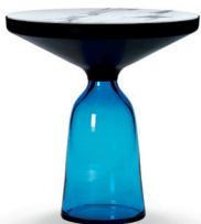
Saphir-blau sapphire blue Marmor marble Bianco Carrara