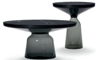
Quarz-grau quartz grey Marmor marble Nero Marquina