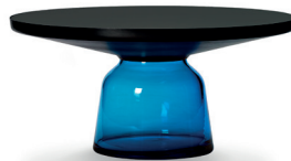
Saphir-blau sapphire blue