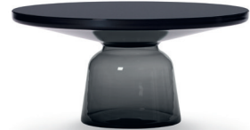
Quarz-grau quartz grey