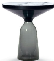
Quarz-grau quartz grey Marmor marble Bianco Carrara