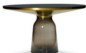
BELL HIGH TABLE 2020