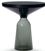
Quarz-grau quartz grey