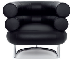
Chrom, Leder schwarz Chrome, leather black