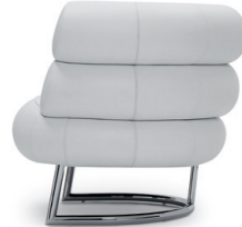
Chrom, Leder weiß Chrome, leather white