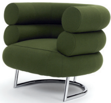
Chrom, Stoff olivgrün Chrome, fabric olive green

Estructura de tubos de acero cromada o con revestimiento pulvimetalúrgico negro. Bastidor en madera de haya con bandas de goma. Acolchado de poliuretano con lana de poliéster. Tapicería de tela o cuero. Patines de plástico negros. Para más detalles y colores, ver lista de precios.