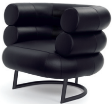
Schwarz, Leder schwarz Black, leather black