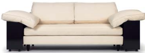
Manila natur nature

Marco de madera de haya acolchado y con muelles. Cojines sueltos con relleno de plumas naturales. Cojines traseros y laterales sueltos rellenos de plumas naturales y estabilizadores. Cajas laterales de MDF con ruedas, lacado en brillo intenso. Parte delantera y trasera siempre negra. Tapicería de tela o cuero. Detalles y colores ver lista de precios.