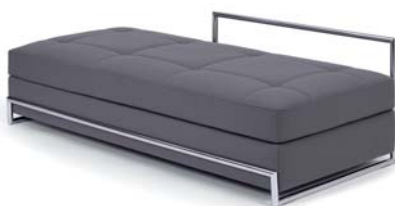
DAY BED 1925