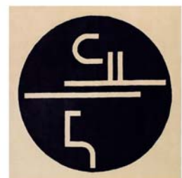
ST. TROPEZ 1925 - 1935