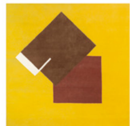
CASTELLAR 1925 - 1935