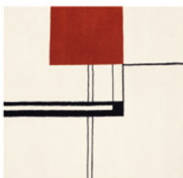
WENDINGEN 1925 - 1935