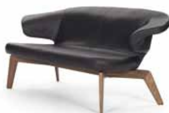
MUNICH SOFA 2010