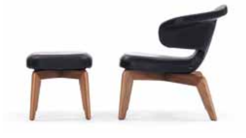
Munich Stool | Munich Lounge Chair

Estructura de madera. Acolchado de poliuretano con poliéster. Tapicería de tela o piel. Detalles, colores y normas europeas probado ver lista de precios.