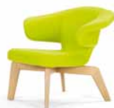
MUNICH LOUNGE CHAIR 2009