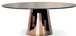
PLI TABLE 2017