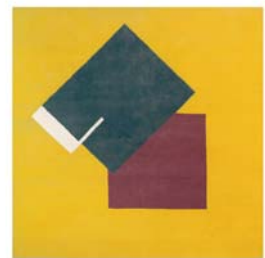
CASTELLAR 1925 - 1935