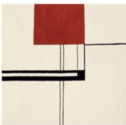
WENDINGEN 1925 - 1935